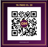
SITIO WEB omnicracia.com