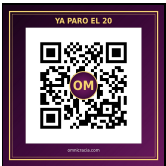
SITIO WEB omnicracia.com