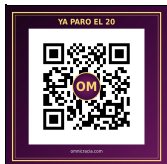
SITIO WEB omniracia.com