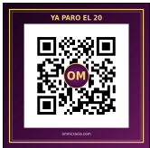
SITIO WEB omnigracia.com